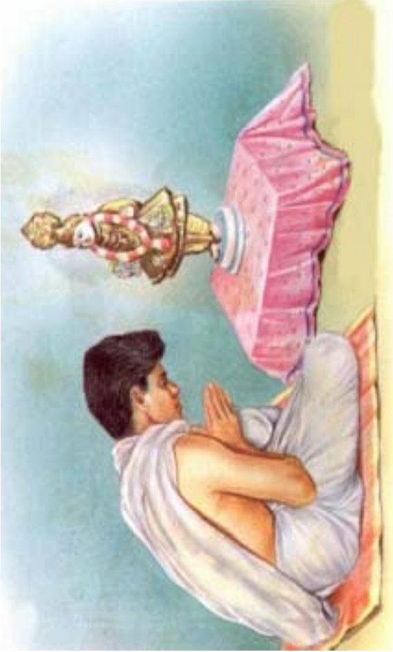
કોઈ એક સભ્યે ગૃહમંદિરમાં પધરાવવા શ્રી ઠાકોરજીને ધૂપ દીપ કરી આરતી કરવી અને અન્ય સભ્યોએ દર્શન કરવા.