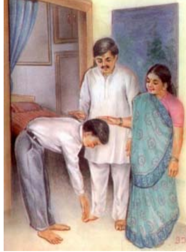
વડીલો-માતાપિતા તથા અન્ય સભ્યોને આદર સહિત જય સ્વામિનારાયણ કહી યથાયોગ્ય નમસ્કાર કરવા.